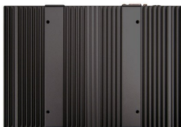
Anclajes frontales VESA 100 mm