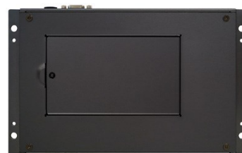
Fácil acceso al disco duro