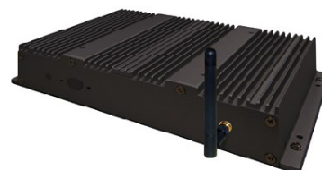
WiFi / bluetooth opcional