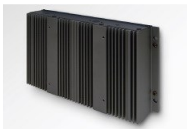
Chasis de aluminio